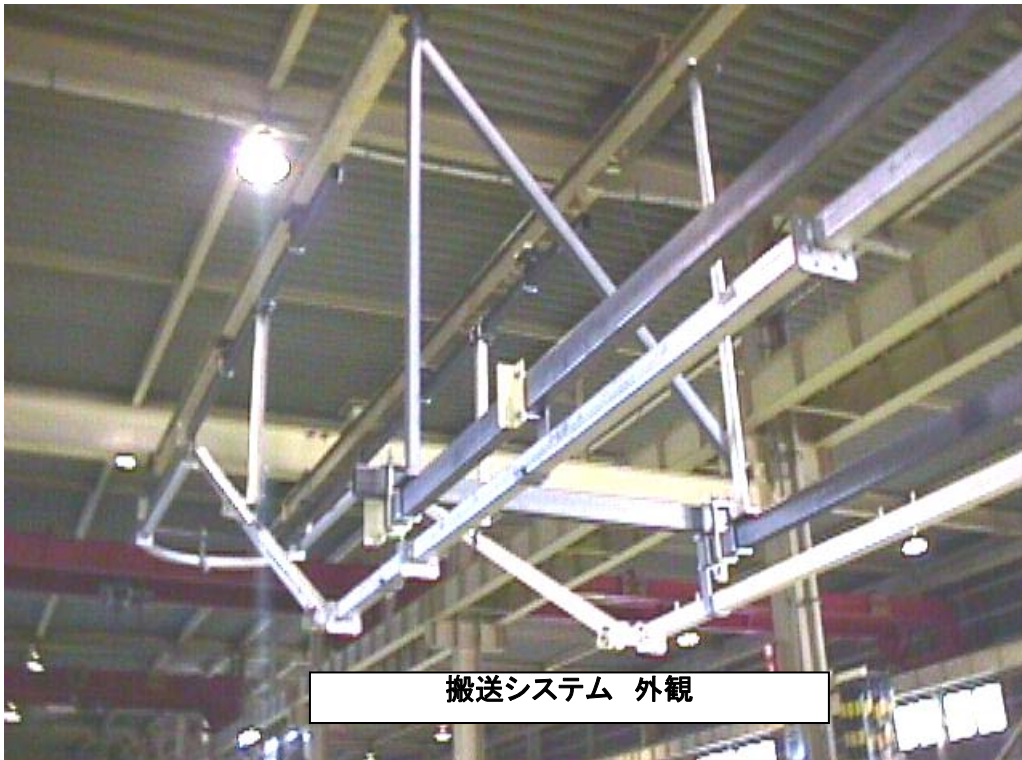
搬送システム 外観

軽量部品搬送コンベアで、洗浄・乾燥に適しています。 レール溝が上向きの為、ゴミ・油落下が低減されます。