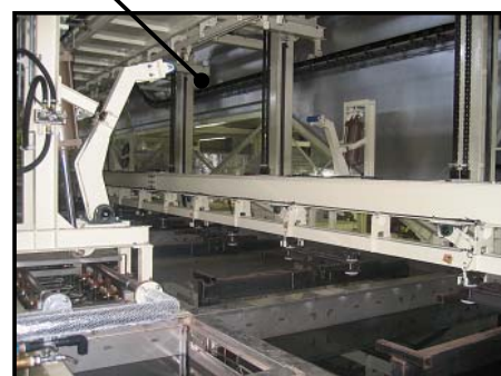
ドロップリフトによる、昇降ディップ方式