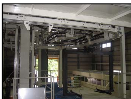
キャリア(P&F) キャリアハンガー